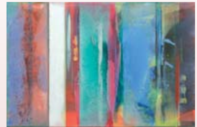
"Sans titre" de Bert RÜCKERT Acrylique sur toile - 60 x 90 cm - 2005

Expositions ouvertes du mardi au dimanche de 15h00 à 18h30 Salle d'exposition située au 2ème étage de l'Hôtel de Ville - 03.81.94.78.33