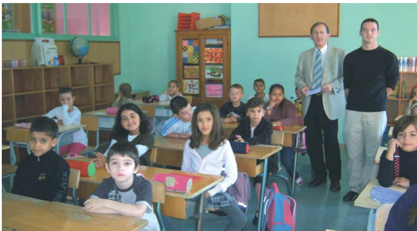
Visite des classes le jour de la rentrée

A Sochaux, la municipalité a souhaité mettre la jeunesse et l'enfance au coeur de ses préoccupations. De la crèche multi-accueil aux emplois saisonniers de jeunes, du centre de loisirs à la MJC, de l'école maternelle au collège, la ville de Sochaux, labellisée "Ville amie des enfants" par l'UNICEF, veille au bien-être et à l'épanouissement des jeunes sochaliens.