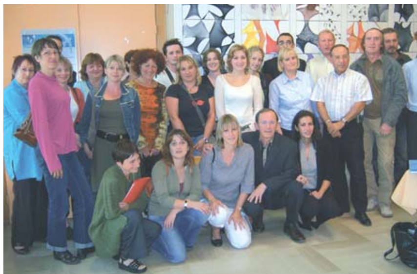
Réunion et accueil des enseignants des écoles maternelles et élémentaires le 8 septembre.

L'accueil périscolaire en soirée proposera ce trimestre trois thèmes successifs qui sont aussi repris le mercredi et au restaurant scolaire.