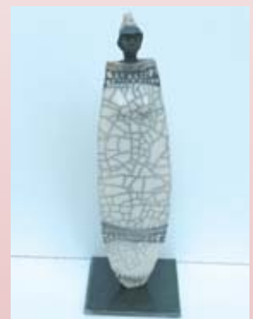
"Africaine" de Marie-Christine GENÉY Raku

Entrée libre pour toutes les expositions.