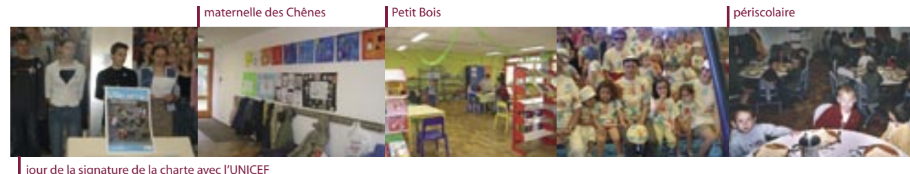
jour de la signature de la charte avec l'UNICEF

Voilà un constat direct et sans ambiguïté sur nos promesses faites en 2001. Cette liste n'étant évidemment pas exhaustive, d'autres chantiers ont vu le jour au gré de nos échanges et de nos initiatives. Vous pourrez aisément le constater dans les interventions des Adjointes qui vont suivre.