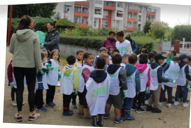
Nettoyons la nature avec l'école maternelle du centre