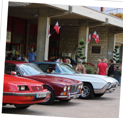
Journée du patrimoine