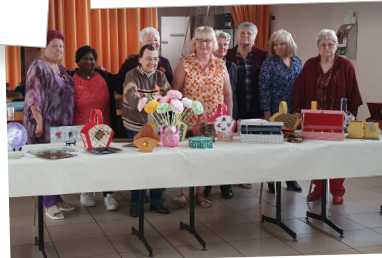
Une exposition-vente de la Maison pour Elles