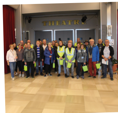
Organisation de la course du Lion