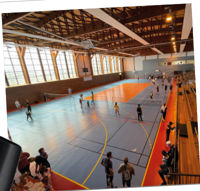
Fête du sport de Sochaux