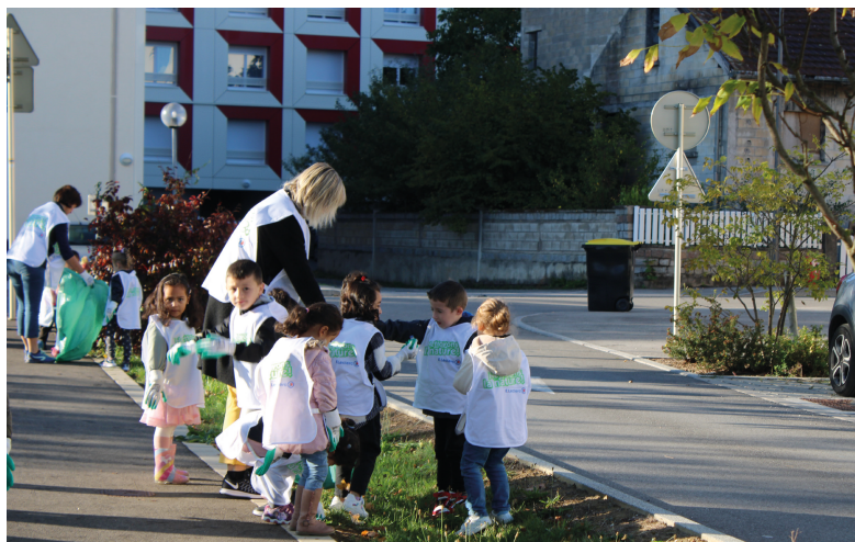
Les élèves de la classe de maternelle de l'école des Chênes à l'occasion de la journée « Nettoyons la Nature » - 25 septembre 2023

La propreté est, en effet, une marque de respect pour chaque habitant-e, mais également pour l'environnement qui doit être préservé. C'est avec ces valeurs de solidarité citoyenne que les écoles s'investissent.